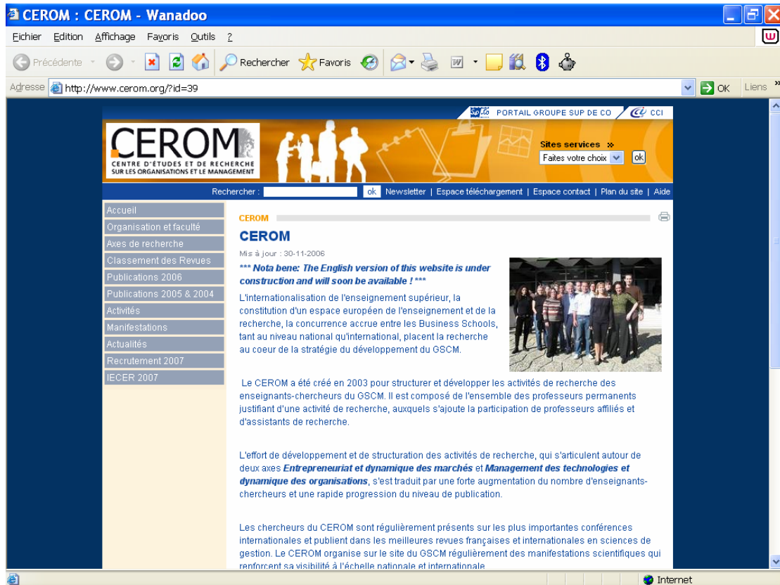
Figure 2 : Le nouveau site de la recherche au GSCM